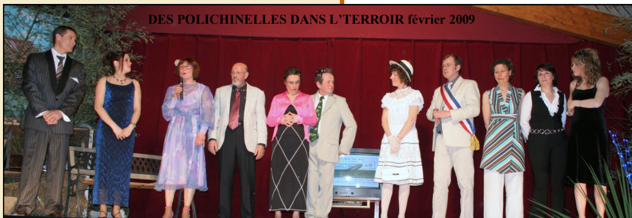
DES POLICHINELLES DANS L'TERROIR février 2009